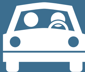
Vedere la depărtare