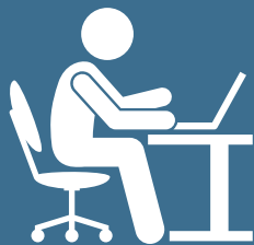
Vedere la distanță intermediară