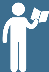
Vedere la apropiere